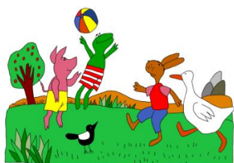
1. Wij hebben respect voor elkaar.

We gaan uit van 4 schoolafspraken. Deze zijn in de school en in alle groepen duidelijk zichtbaar opgehangen en worden regelmatig met de kinderen besproken/herhaald. Ook vermelden wij in de 'Info' via Parro wanneer we een nieuwe regel bespreken. De afspraken worden door de tekeningen van 'Kikker' ondersteund.