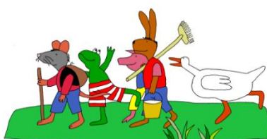
2. Wij zijn zuinig en netjes op de spullen van onszelf, de ander en school.